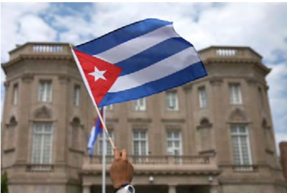
Embajada de Cuba en Washington D. C.

“Lo que sí ha permitido la limitada colaboración por parte de Estados Unidos es confirmar que no existe evidencia alguna de que en Cuba se produjeron ataques o pudo haberse cometido algún acto deliberado contra ese personal”, afirmó. ≡