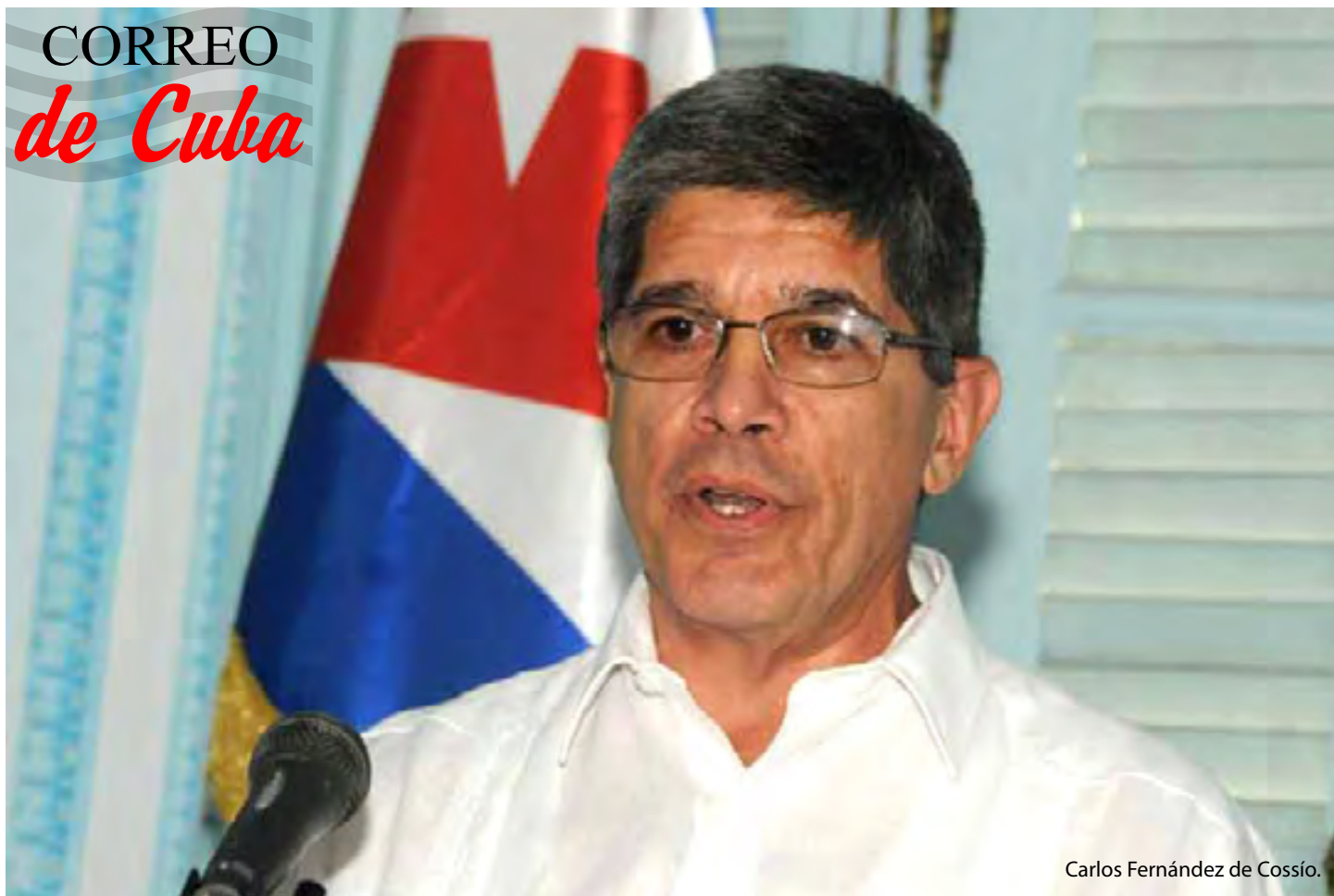
Carlos Fernández de Cossío.

La decisión de mantener indefinidamente la reducción de su personal diplomático en Cuba y el empeño en calificar como ataques alegados incidentes de salud representan muestras de la hostilidad de Estados Unidos hacia la Isla.