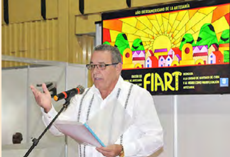
Arturo Valdés, presidente del Fondo Cubano de Bienes Culturales.