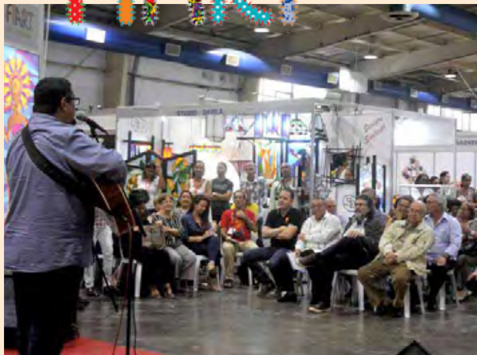
Abel Prieto, ministro cubano de Cultura, y Miguel Barnet, presidente de la Unión de Escritores y Artistas de Cuba, presidieron la gala de apertura.

Por estas razones, la vidriería cubana contemporánea debe su