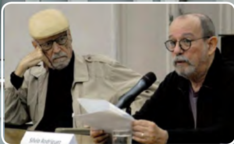
Íconos de la cultura cubana; el cantautor Silvio Rodríguez y el actual presidente de Casa de las Américas, Roberto Fernández Retamar.